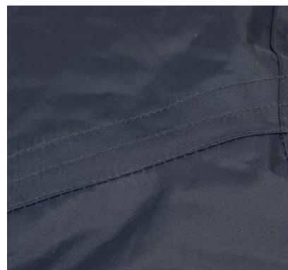
Coudes renforcés et préformés pour une plus grande durabilité.