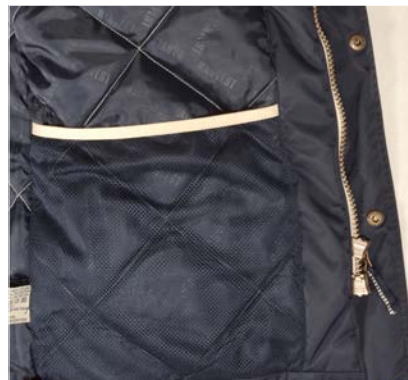
Deux poches mesh intérieures spacieuses.