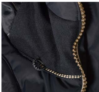
Polaire chaude et anneau pour écouteurs au col.