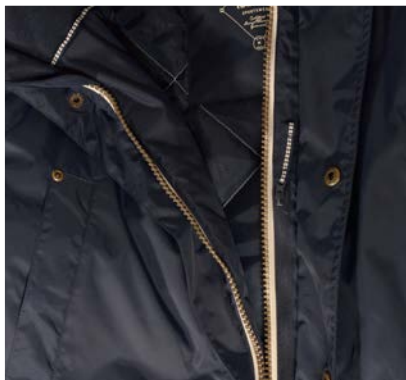
Poche extérieure intérieure (poche napoléon) avec ouverture intérieure pour écouteurs.