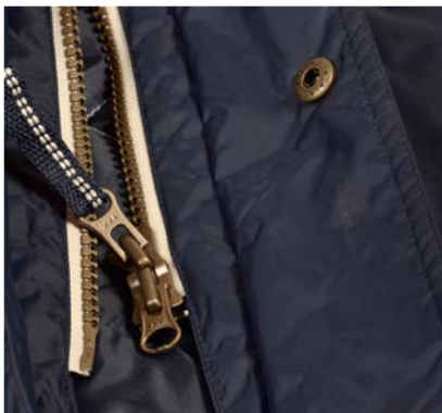
Fermeture double curseur pour un confort et une mobilité plus importante.

Pour le reste, c'est tout simplement un très beau design afin d'allier le style et la fonctionnalité!